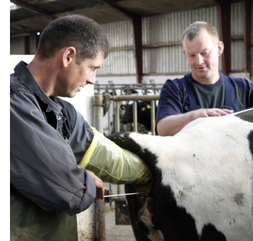
ReproAnalyse gør det muligt at målrette optimering af besætningens reproduktionsresultater.

Udskriften bygger på ganske store datamængder fra Kvægdatabase vedr. bedriften – dels de traditionelle dataregistreringer og dels kliniske dataregistreringer. Der udføres en statistisk analyse af data, inden udskriften vises. ReproAnalyse giver en vurdering af, hvilke hændelser i driftsenheden, der er vigtige at tage højde for, for at opnå en bedre reproduktion. Brug udskriften som grundlag for sparring med din rådgiver for at få det fulde udbytte.